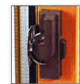
空かけ防止クレセント (亜鉛ダイキャスト製)