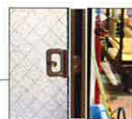
召し合せ框に加熱発泡材を貼付