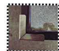
ガラスコーナー金具 ※アルミ樹脂複合タイプの場合にのみ取付有