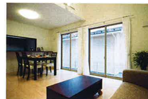
シャンパングレイ (LGS)