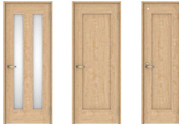
06 デザイン 01 デザイン 01 デザイン