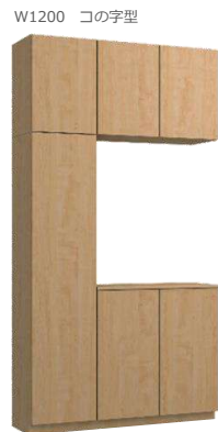
フラット縦木目タイプ