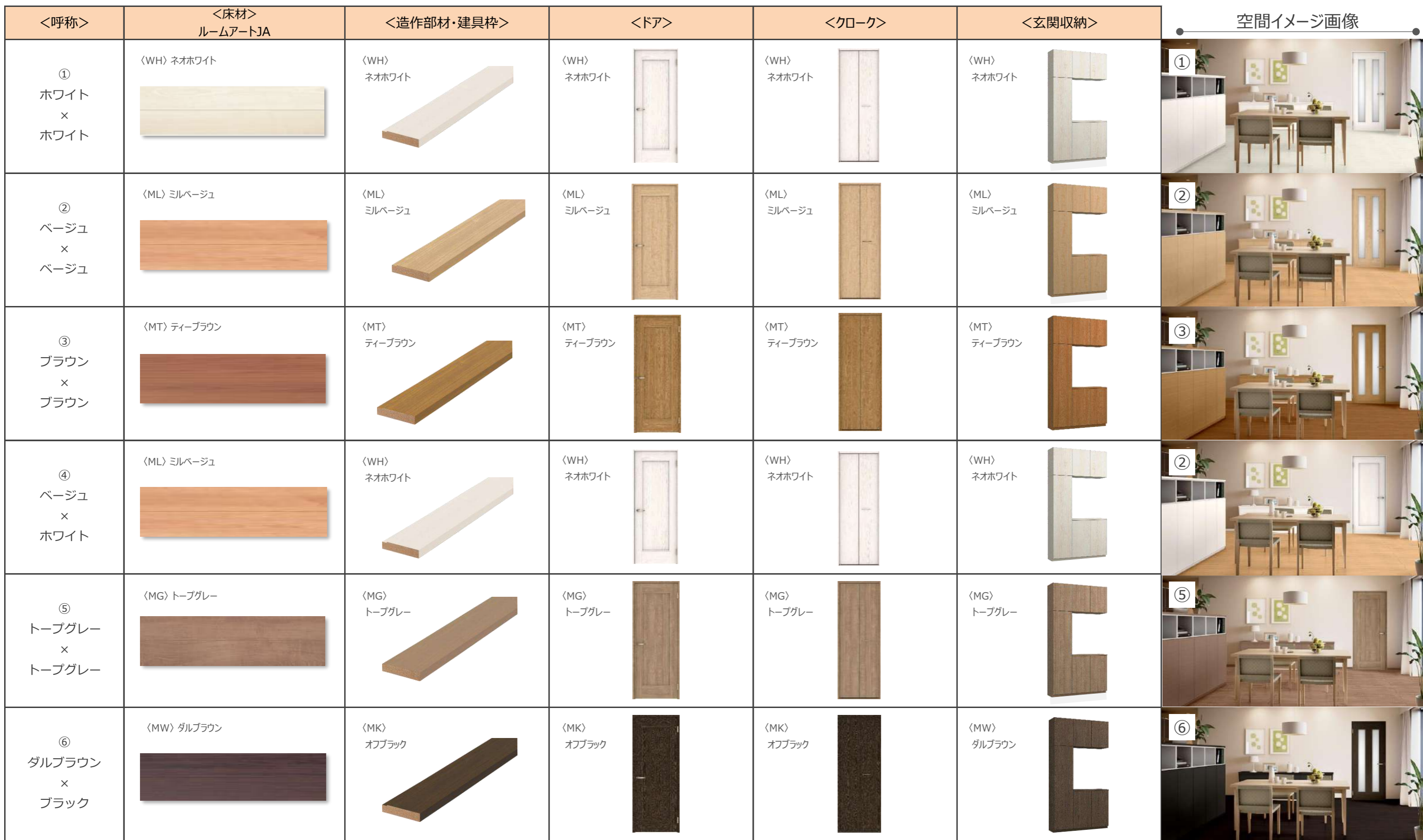
床材カラーバリエーション