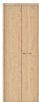
フラット 縦木目デザイン